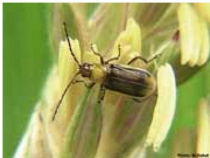
Der 5-7 mm große Maiswurzelbohrer auf einer Maisfahne

Der Maiswurzelbohrer, der bedeutendste Schädling des Maises, ist seit 1992 in Europa und seit 2002 in Österreich aufgetreten. Dabei handelt es sich um einen sogenannten Quarantäneschadorganismus aufgrund der Pflanzenschutzrichtlinie 2000/29/EG. Dies bedeutet, dass Maßnahmen gegen die Ausbreitung dieses Schadorganismus gesetzt werden müssen.