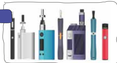
E-Schrott / ASZ

Sie können in jeder Trafik zurückgegeben werden oder müssen als Elektro-Kleingeräte in das ASZ gebracht werden.